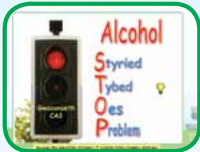
CA2 Dechrau Meddwl am y Problem